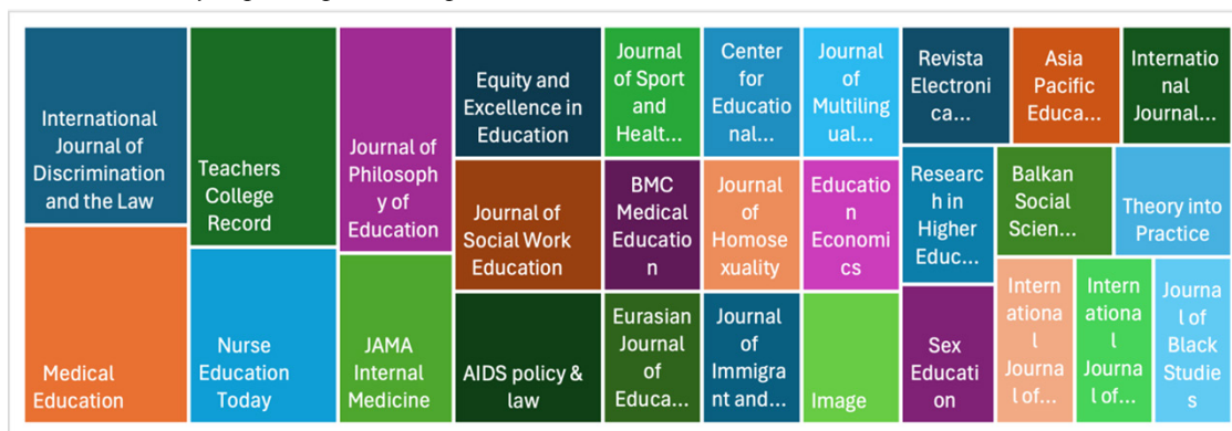
Figura 3 Revistas con mayor participación en publicaciones

Nota. Elaboración con datos tomados de Scopus procesados a través de Scimago Graphica